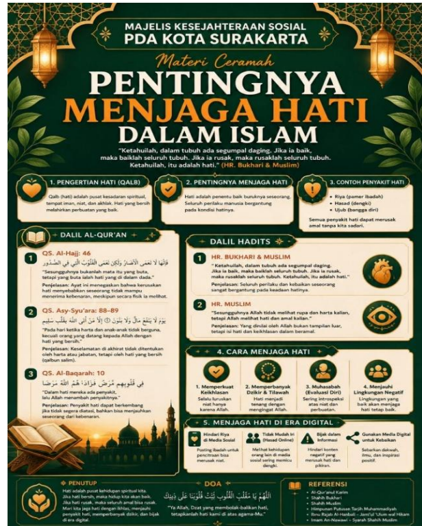
Gambar 5. Hasil Pembuatan Poster oleh Peserta Menggunakan ChatGPT