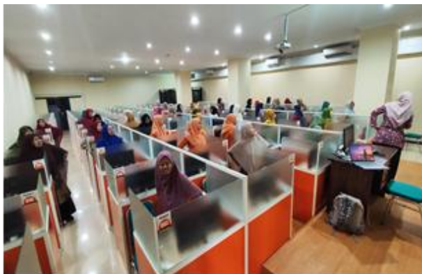
Gambar 2. Kegiatan Ice Breaking pada Pertengahan Sesi Pelatihan