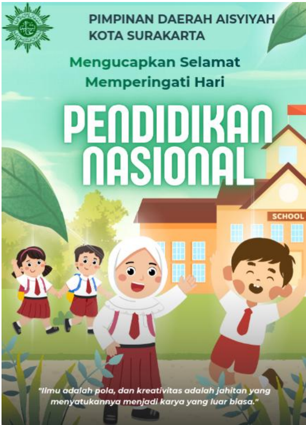
Gambar 4. Poster Hasil Karya Peserta Menggunakan Canva

Pendampingan secara langsung memberikan kesempatan kepada peserta untuk berkonsultasi mengenai berbagai kendala teknis yang dihadapi selama praktik. Keterlibatan mahasiswa pendamping dan anggota LPP PDA 'Aisyiyah Kota Surakarta turut mempercepat proses pembelajaran, sehingga seluruh peserta dapat menyelesaikan tugas praktik dengan baik (Nurdin Nurdin, 2026a, 2026b). Beberapa hasil karya peserta berupa poster yang dibuat menggunakan Canva dengan dukungan ChatGPT dan ChatmuGPT disajikan pada gambar berikut.