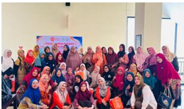
Gambar 3. Foto Bersama Peserta dan Tim Pengabdian kepada Masyarakat