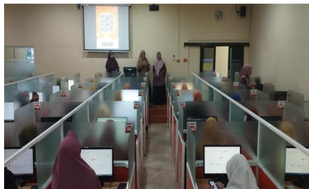
Gambar 1. Kegiatan Pre test

Seluruh materi, file latihan, dan panduan teknis dihimpun dalam satu folder cloud storage bersama yang dapat diakses oleh para pengurus kapan saja untuk mendukung pembelajaran dan latihan mandiri. Pendekatan yang menggabungkan ceramah interaktif dan praktik langsung ini sejalan dengan model pelatihan digital efektif yang dikembangkan oleh Bintang et al. (2026). Pelaksanaan pelatihan menunjukkan tingkat antusiasme peserta yang tinggi. Hal ini terlihat dari keterlibatan aktif peserta dalam sesi diskusi, praktik penggunaan aplikasi, serta kemampuan mereka menghasilkan berbagai produk digital sederhana selama pelatihan berlangsung. Temuan tersebut menunjukkan bahwa materi yang diberikan sesuai dengan kebutuhan organisasi dan dapat diterapkan secara langsung untuk mendukung administrasi, publikasi (Septiarini et al., 2022; Ulfa et al., 2024), serta dakwah digital 'Aisyiyah. Seluruh rangkaian kegiatan terdokumentasi sebagaimana ditunjukkan pada gambar berikut.